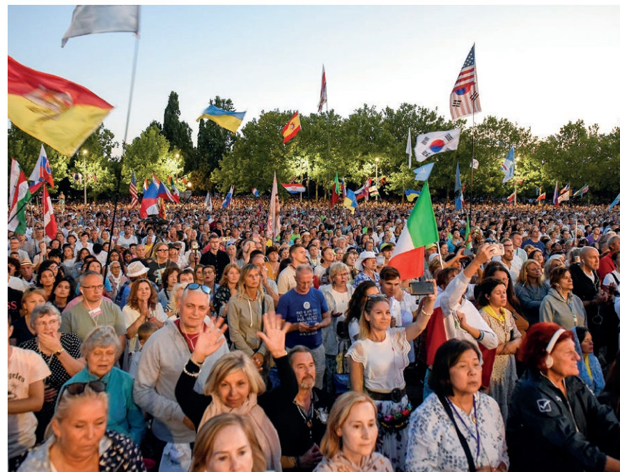
Internationale Seminare/Exerzitien in Medjugorje 2026

Für die Flugwallfahrten ist eine Anmeldung mindestens zwei Monate vor Abflug aus organisatorischen Gründen empfehlenswert.